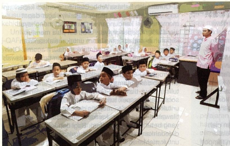
Program j-QAF membantu memperkukuh penguasaan ilmu agama dalam kalangan murid.

Selamat berangkat ke negeri abadi, Pak Lah. Kami mendoakan agar Allah SWT menyambutmu dengan penuh rahmat dan keampunan-Nya di syurga yang tertinggi. 🕌