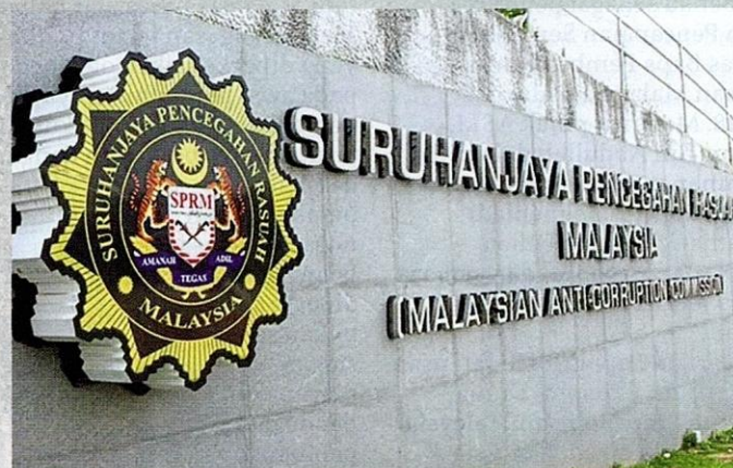
Antara sumbangan besar Tun Abdullah dalam usaha memartabatkan integriti di negara ini.

Era Tun Abdullah turut menyaksikan pelancaran Koridor Ekonomi yang berfungsi sebagai pemangkin pembangunan wilayah yang lebih seimbang. Antara koridor utama yang dilancarkan termasuklah Iskandar Malaysia (Wilayah Selatan Johor), Koridor Utara (NCER), Koridor Pantai Timur