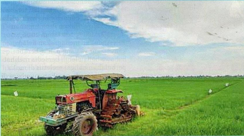
Koridor Utara (NCER)

(ECER), Koridor Sabah (SDC) dan Koridor Sarawak (SCORE). Setiap Koridor ini direka untuk menarik pelaburan domestik dan asing serta mempercepat pembangunan ekonomi di luar Lembah Klang. Inisiatif ini menunjukkan kesungguhan Tun Abdullah dalam usaha memastikan pembangunan negara tidak tertumpu di kawasan bandar sahaja, malah dinikmati secara menyeluruh oleh rakyat terbanyak.