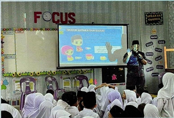
Program j-QAF yang diperkenalkan semasa pentadbiran Tun Abdullah.

termasuklah keimanan kepada Allah, pembangunan ekonomi yang seimbang, integriti budaya dan moral, serta perlindungan hak minoriti. Melihat kepada senarai prinsip ini, menunjukkan usaha gagasan ini untuk membina masyarakat Islam yang maju dan dinamik, tetapi tetap berakar pada nilai agama. Oleh itu, gagasan Islam Hadhari mampu untuk menangani stereotaip negatif masyarakat dunia terhadap Islam sebagai agama yang mundur atau agresif.