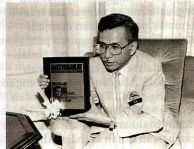
Tun Daim Zainuddin ketika dinobatkan sebagai Tokoh Dewan Masyarakat pada tahun 1989.

beliau memperkenalkan beberapa program pembangunan untuk membantu meningkatkan taraf hidup golongan miskin, khususnya di kawasan luar bandar. Inisiatif ini bertujuan untuk mengurangkan jurang ekonomi antara masyarakat bandar dengan luar bandar, serta memastikan bahawa kemakmuran negara dapat dinikmati oleh semua lapisan masyarakat. Walaupun banyak dasar ekonomi yang diperkenalkan pada ketika itu bertujuan untuk memperkasakan sektor perindustrian, Tun Daim juga tidak melupakan peri pentingnya pembangunan dalam sektor pertanian dan luar bandar sebagai sokongan terhadap ekonomi negara.