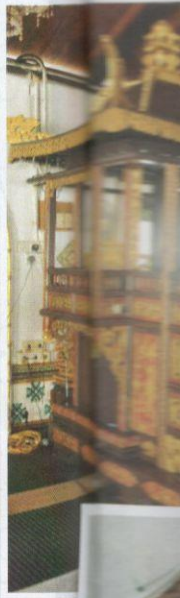
Mahkota dan sulur bayur di Masjid An-Nur, Peringgit.

Hukum-hukum berkaitan Islam juga turut digunakan dalam urusan perundangan di seluruh negeri Melaka. Dikatakan istana raja, balairung dan masjid terletak di Bukit Bendera yang kini dikenali sebagai Bukit St. Paul. Namun begitu, selepas kedatangan penjajah Portugis pada tahun 1511, bangunan tersebut telah dimusnahkan. Portugis bukan sahaja menjarah sejarah Islam di Melaka, malahan memaksa orang-orang Melaka meruntuhkan dan menimbus bekas tapak istana, balairung mahupun masjid yang