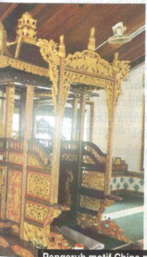
Pengaruh motif China pada pintu gerbang dan mimbar Masjid Tengker.

Walaupun pembinaan masjid di Melaka selepas era merdeka tidak lagi menitikberatkan unsur seperti yang dinyatakan, namun masih menekankan unsur keindahan dan kesesuaian masa serta fungsi penggunaannya. Kebiasaannya di sesebuah kariah yang diduduki oleh umat Islam mempunyai sebuah masjid dan beberapa buah surau yang dapat diumpamakan sebagai