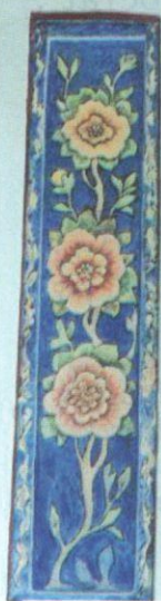
Dewan Budaya | BIL. 10 2020