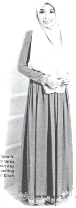
Amirah gembira N. A Beauty terus bertahan dan berkembang seiring perkembangan Elrah

Handwritten notes at the bottom of the page, including a phone number: 011-2222 2222