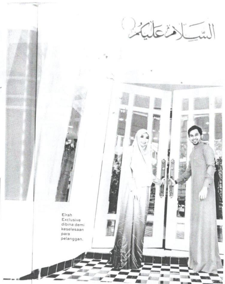
Elrah Exclusive dibina demi keselesaan para pelanggan.