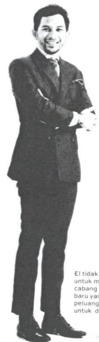
El tidak menolak untuk mencuba cabang perniagaan baru yang lain andai peluang terbuka untuk dirinya

pengedar dan lebih daripada 100 ejen di seluruh Malaysia dan luar negara seperti Egypt, Thailand, Brunei, Singapura dan Indonesia. Dalam pada itu, Elrah Exclusive juga bakal tampil dengan variasi produk terbarunya iaitu kain ihram, tasbih, butang baju Melayu, sejadah dan koleksi kasual untuk golongan Adam yang bakal menemui pelanggan selepas Hari Raya Aidilfitri nanti. Melihat sambutan cukup menggalakkan daripada para pelanggan, El dan Amirah turut menyasarkan untuk membuka francais Elrah Exclusive di beberapa buah negeri. Antaranya Kelantan, Pahang dan Johor. Tidak ketinggalan, Thailand juga bakal menjadi negara pilihan memandangkan permintaannya yang diterima cukup tinggi.