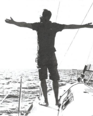
Pastikan polisi yang dipilih terbaik untuk keperluan anda.