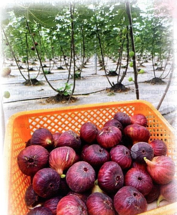
Keunikan buah tin yang mempunyai nilai tinggi dalam pasaran.

Pada tahun 2018, Hafidz mula meneroka idea pertanian komersial dengan fokus kepada buah tin, tanaman yang unik tetapi mempunyai nilai ekonomi yang tinggi. Dari situ, Benefigs lahir sebagai suatu usaha yang bukan sahaja memacu pengeluaran tetapi turut menjadi contoh kepada usahawan muda untuk berani mencuba sesuatu yang baharu.