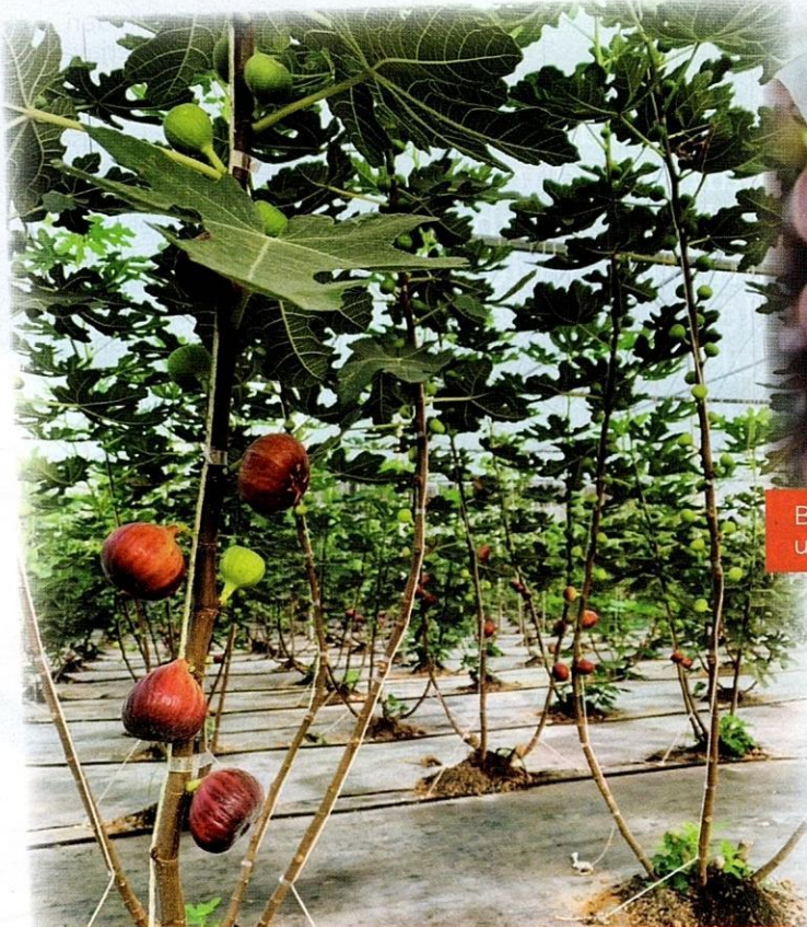
Pokok buah tin mengeluarkan buah sepanjang tahun.