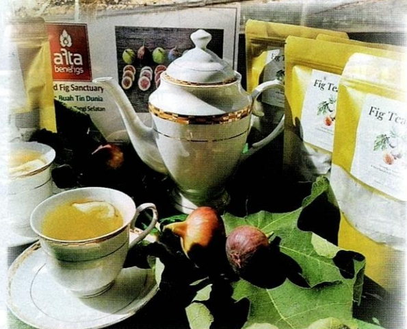
Buah tin juga dijadikan sebagai teh.