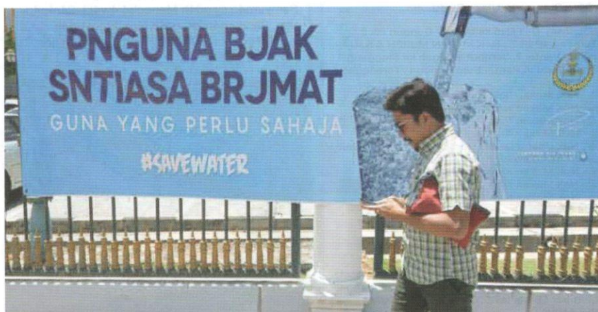
Kain rentang yang menggunakan ejaan yang salah, iaitu ejaan yang diringkaskan mengikut kelaziman ejaan oleh pengguna media sosial dalam komunikasi media sosial.

Modenisasi bahasa dalam media sosial juga melibatkan penggunaan perkataan yang disingkatkan ejaannya. Bagi Nik Safiah Karim (2010), berlaku penggunaan ejaan yang ringkas secara berleluasa disebabkan penerimanya lebih selesa malah turut menggunakan