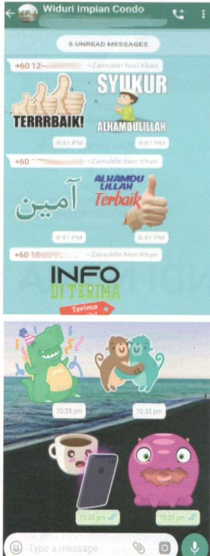
Penggunaan pelekat yang mendominasi komunikasi dalam WhatsApp pada hari ini.

inilah yang dikatakan kreativiti interaksi dalam media sosial. Pengguna media sosial tidak lagi membalas mesej atau menghantar pesanan menggunakan teks, tetapi sekadar menghantar