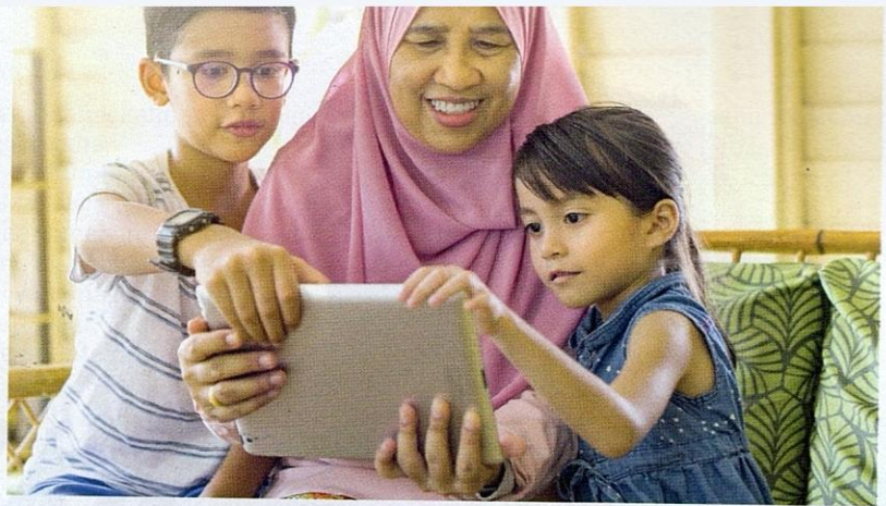
Ibu bapa perlu memantau program yang ditonton oleh anak-anak demi kemaslahatan masa depan.

Selain itu, perlu adanya ketegasan dalam tindakan menapis atau