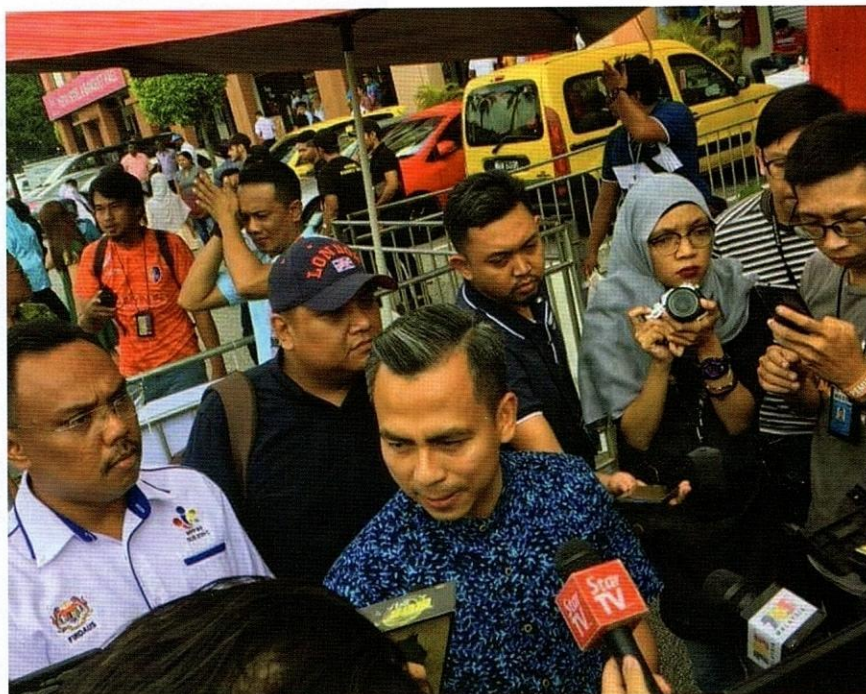
Media mempunyai pengaruh yang kuat terhadap seseorang individu, terutama tokoh tertentu untuk menjaga reputasi mereka.

Melalui kekerasan bahasa lisan dan tulisan yang disampaikan melalui media, emosi dan mental mereka yang menjadi sasaran akan tercedera, berbanding dengan kekerasan fizikal yang menyebabkan kecederaan fizikal dan kematian. Sebagai alat komunikasi, bahasa dapat digunakan sebagai wahana untuk merakamkan dan melaporkan peristiwa dan kejadian kekerasan dalam masyarakat. Namun demikian, dalam hal ini, perkara penting yang perlu diberikan perhatian ialah usaha perlu dilakukan untuk tidak menggunakan bahasa keras bagi mengelakkan tindakan berbentuk kekerasan. Ingat, bahasa keras dengan