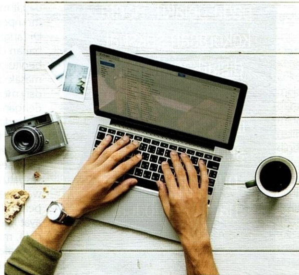
Berita di hujung jari boleh dicapai pada bila-bila masa.

Hal ini membawa kita kepada persoalan, apakah tujuan semua bahan editorial itu disiarkan? Adakah sekadar memenuhi halaman majalah, akhbar atau sebagainya? Hakikatnya, sesuatu