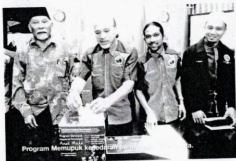
Program Memupuk kepedulian pada masyarakat.

Pada masa yang sama, tujuan PPIM ditubuhkan adalah untuk mengubah corak kehidupan khususnya kalangan pengguna Islam. Saya akui pengguna Islam masih berada ditapak lama iaitu bersifat lemah, amat jahil, kerap kali ditekan tidak pandai membela dan tidak dihormati. Atas sebab-sebab itu PPIM ingin