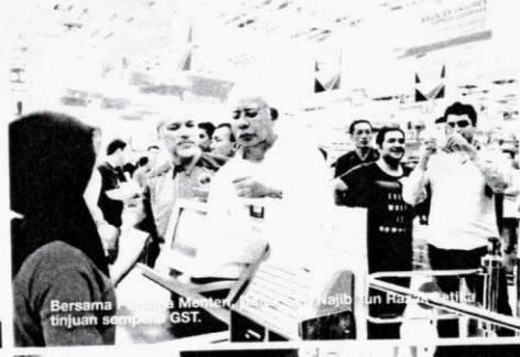
Bersama Menteri Kanan, tujuan sempang GST.

aksakan perjuangan bagi menentuhkan hak dan mudah dapat dikembalikan dengan bijaksana dan tidak perlu takut lagi.