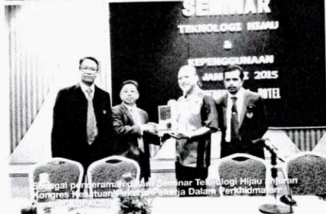
Sebagai peraraman pada Seminar Teknologi Hijau dan Wawasan Keselamatan, Menteri Kanan Dalam Perkhidmatan.

Terus terang, saya katakan pengguna hari ini agak ‘anjil’. Saya amat gementan tentang situasi jualan murah yang diadakan setiap musim perayaan atau pengujung tahun. Saya doakan pengguna hari ini begitu mudah sekali terpengaruh dengan promosi/promosi jualan murah yang