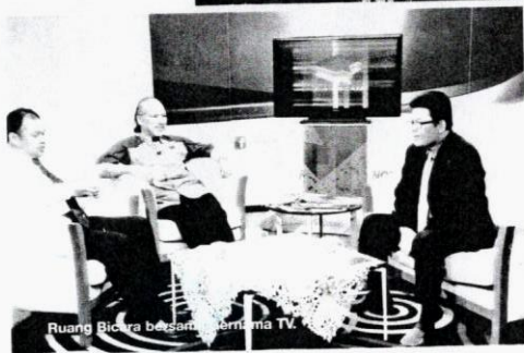
Ruang Bicara bersama perantara TV.

“Apa yang pasti, pengguna-pengguna yang pernah menjadi mangsa kebanyakan terdirir daripada pelbagai latar belakang. Bukan sahaja masyarakat di desa dan tidak berpendidikan tempias yang sama turut diadapi oleh golongan berpendidikan tinggi atau profesional,” akunya tentang sikap sebahagian pengguna yang kurang berilmu membuka ruang untuk terus terjerumus dalam kes penipuan. H