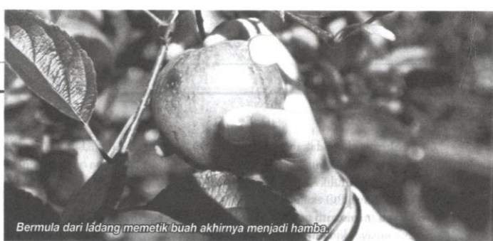
Bermula dari ladang memetik buah akhirnya menjadi hamba.