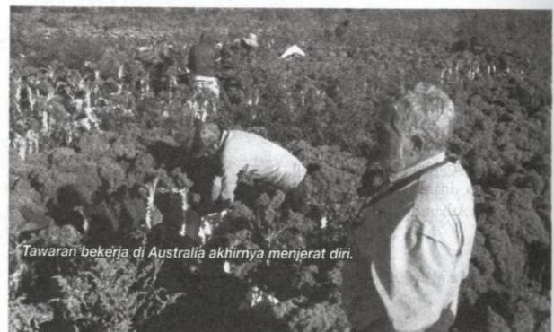
Tawaran bekerja di Australia akhirnya menjerat diri.

"Mereka terdedah untuk menjadi mangsa dera, diugut, menjadi mangsa