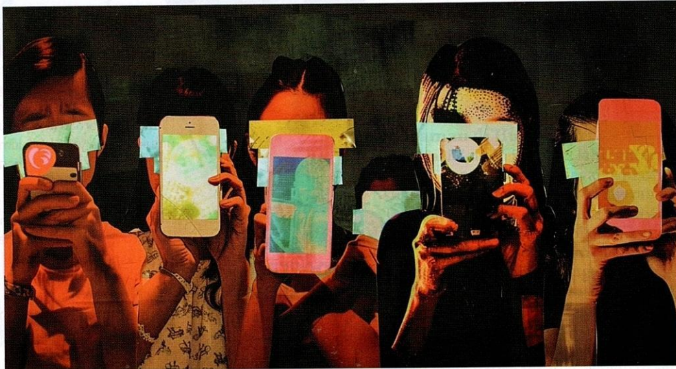
Kemunculan peranti canggih telah mengubah landskap bagi akses terhadap sesuatu kandungan.

secara keseluruhannya. Oleh itu, kesedaran akan bahayanya isu ini perlu diambil dengan langkah yang efektif agar dapat melindungi generasi muda daripada pengaruh yang buruk.