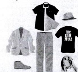
Pakaian dan kasut