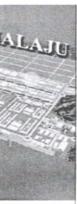
Perindustrian Samaraju, Sarawak.

Untuk memacu pertumbuhan, antaranya bergantung pada pelaburan domestik dan projek kerja raya atau infrastruktur. Pelaburan domestik dapat dilihat dalam keutamaan pertama, antaranya melalui pembangunan Malaysian Vision Valley (unjuran pelaburan RM5 bilion pada tahun 2016), pelaksanaan Cyber City Centre di Cyberjaya (dengan nilai pembangunan hampir RM11 bilion dalam tempoh lima tahun), pembangunan Bandar Lapangan Terbang atau Aeropolis KLIA (jangka pelaburan sebanyak RM7 bilion), pelaburan RM6.7 bilion oleh Khazanah Nasional Berhad dalam sembilan projek domestik berimpak tinggi, pelaburan seterusnya untuk Projek RAPID Complex di Pengerang, Johor (dianggarkan RM19 bilion untuk tahun 2016), pembangunan Rubber City di Kedah (dengan peruntukan RM320 juta, Taman Perindustrian Samaraju, Sarawak, sebanyak RM142 juta, dan Jeti Minyak Kelapa Sawit di Sandakan, Sabah, sebanyak RM20 juta), serta pembangunan industri kimia, elektronik dan elektrik, mesin dan peralatan, aeroangkasa, peranti perubatan dan perkhidmatan (dengan peruntukan RM730 juta).