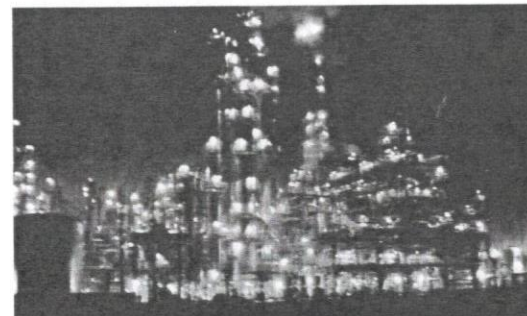
Meskipun menjadi negara pengeluar minyak, Malaysia tidak terkecuali terhimpit dengan krisis global minyak mentah dunia.

Defisit fiskal yang semakin meningkat jika CBP tidak dilaksanakan jelas menggambarkan bahawa keputusan kerajaan melaksanakan CBP betul dan tepat pada masanya untuk mencapai sasaran