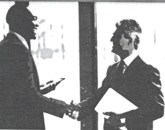
Usahawan perlu membentuk diri mereka agar menjadi usahawan kelas pertama yang berkredibiliti.

polemik berterusan dengan alasan kenaikan harga minyak atau salah kerajaan semata-mata.