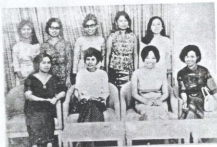
Sewaktu menyertai majlis merikan Tun Fatimah Hashim sebagai menteri wanita pertama tahun 1969.