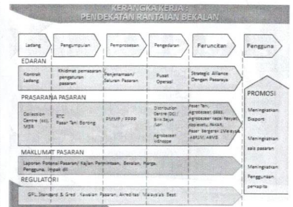
Rajah 1 Rantaian pemasaran FAMA.

Selain mengambil langkah pemasaran yang proaktif dan berkesan, tambah beliau, FAMA meluaskan ruang pasaran bagi membolehkan rakyat memperoleh barang keperluan, khususnya hasil keluaran agromakanan dengan mudah, cepat,