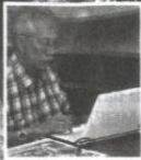
Tokoh Wartawan Negara 2011