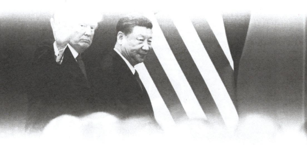
Donald Trump dan Xi Jinping.

Apakah tahun 2018 akan terukir dalam sejarah dunia sebagai tahun pertarungan dua kuasa besar untuk mengekalkan keunggulan ekonomi masing-masing, seterusnya membawa dunia kembali ke zaman Perang Dingin?