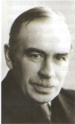
John Maynard Keynes