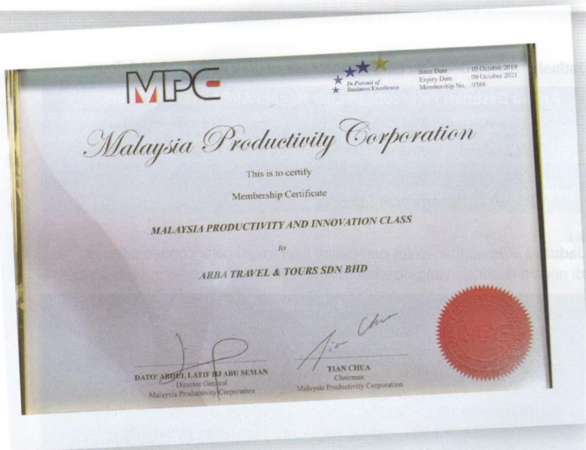
Jadual 3 Antara anugerah yang dimenangi dan diterima ARBA Travel & Tours.