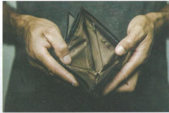
Lingkungan gaji yang rendah menyebabkan berlakunya ketidakseimbangan dalam kerangka kuasa beli.

Biarpun datanya mengunjurkan pendapatan sedemikian untuk kesesuaian kos sara hidup kontemporari, namun pada hari ini Malaysia masih kekal menjadi negara yang menunjukkan kadar kenaikan gaji yang paling rendah berbanding dengan negara ASEAN yang lain. Satu kaji selidik yang dilakukan oleh firma perunding kekayaan dan kerja, iaitu Mercer Malaysia pada tahun 2019 mendapati Malaysia merupakan negara ASEAN yang mencatatkan peningkatan gaji terendah berbanding dengan enam buah negara ASEAN membangun yang lain.