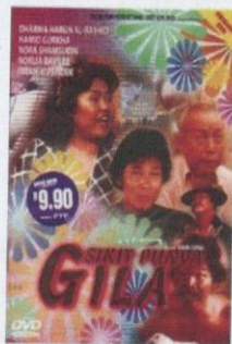
Filem Sikit Punya Gila , sebuah filem komedi yang diterbitkan pada tahun 1987.