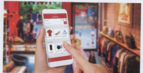
Platform penjualan secara dalam talian menjadi pilihan para penjual sekarang.

Keadaan yang berlaku ini pada dasarnya menggambarkan bahawa masyarakat sedang berusaha untuk berjimat-cermat dengan mengurangkan kos perbelanjaan yang tinggi. Platform secara dalam talian kini menjadi pilihan