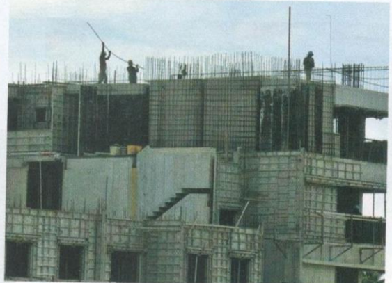
Mampukah rakyat memiliki rumah dengan harga yang tidak selari dengan pendapatan?

Perkara ini pada dasarnya dikeruhkan oleh ketidaksielarisan kadar kenaikan pendapatan dan harga rumah yang meningkat secara mendadak. Menurut data yang dikeluarkan oleh Pusat Informasi Hartanah Negara (NAPIC), harga rumah di Malaysia didapati meningkat hampir 100 peratus dari tahun 2010 hingga 2020. Meskipun kerajaan telah memperluaskan program rumah rakyat, namun harga jualannya masih tinggi berbanding dengan pendapatan rakyat kebanyakan. Pada hari ini, rata-rata harga rumah mampu milik ditawarkan bermula pada harga RM150 000 hingga RM300 000. Biarpun program rakyat ini sedikit sebanyak membantu mengurangkan kos sara hidup, namun unit perumahan yang dibina sangat terbatas berbanding dengan lambakan perumahan tidak mampu milik yang dibina.