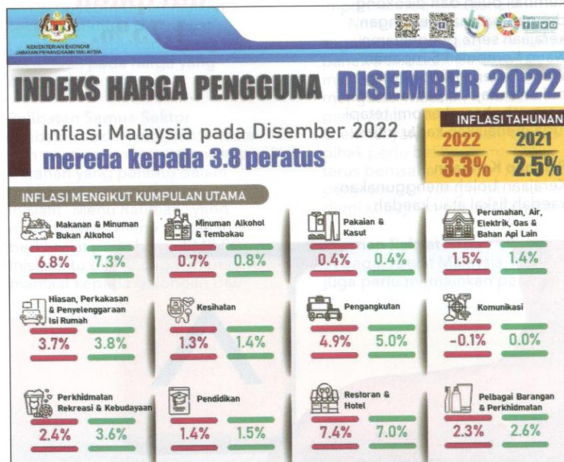
Rajah 2 Indeks Harga Pengguna bagi Bulan Disember 2022.