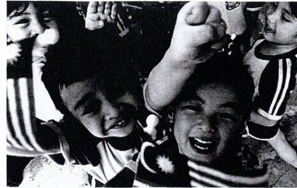
Generasi pelajar yang mempunyai identiti nasional yang jelas diharapkan mengikut Pelan Pembangunan Pendidikan.

dengan mengambil kira pencapaian lampau dan membandingkannya dengan tanda aras antarabangsa. Langkah ini juga wajar jika kita mahu membawa negara kita ke taraf dunia antarabangsa. Kelihatan bahawa visi pelan ini bersifat masa depan.