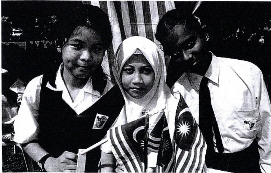
Bahasa kebangsaan menjadi bahasa pemersatu dalam usaha untuk memupuk perpaduan dalam kalangan murid berbilang bangsa.

Pelan Pembangunan Pendidikan ini juga digubal bagi menilai prestasi semasa sistem pendidikan negara