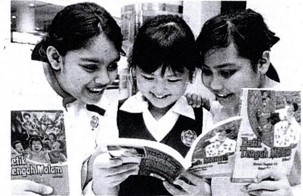
Bahasa kebangsaan menjadi wahana pengembangan ilmu pengetahuan.

Apakah pihak yang terlibat tidak sedar tentang peranan yang dapat dimainkan oleh bahasa kebangsaan sebagai wahana ilmu pengetahuan