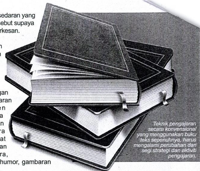
Teknik pengajaran secara konvensional yang menggunakan buku teks sepenuhnya, harus mengalami perubahan dari segi strategi dan aktiviti pengajaran.

Alat yang memungkinkan kita untuk melihat perkara realiti dalam perspektif yang lain disebut metafora. Pembinaan imaginasi ini dapat diperhatikan melalui pengajaran puisi. Kemampuan aneh ini terletak pada pusat daya intelektual, kreativiti, dan imaginasi manusia, di samping berimaginasi untuk menggambarkan unsur konkrit dan abstrak. Aspek ini penting untuk membantu murid dalam mempertahankan kemampuan agar secara nyata tetap ada melalui aktiviti atau latihan yang sering digunakannya pada waktu pengajaran. Cara ini akan membantu