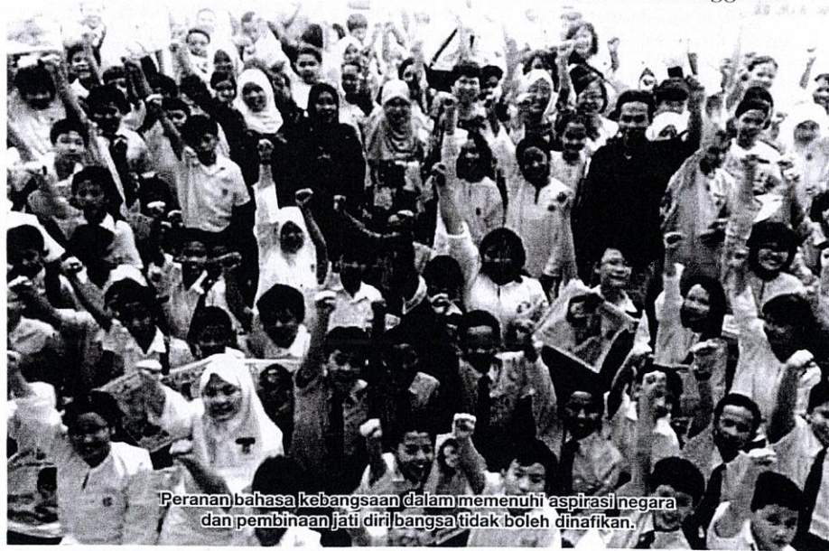
Peranan bahasa kebangsaan dalam memenuhi aspirasi negara dan pembinaan jati diri bangsa tidak boleh dinafikan.

Demi kesempurnaan pelaksanaan pelan ini dan meneruskan usaha memartabatkan bahasa Melayu, sebaik-baiknya huraian tentang bahasa Melayu tidak kelihatan dianaktirikan. Pelan ini dilihat kurang menegaskan usaha memartabatkan bahasa Melayu sebaliknya lebih memperkukuh dan sekali gus memartabatkan bahasa Inggeris.