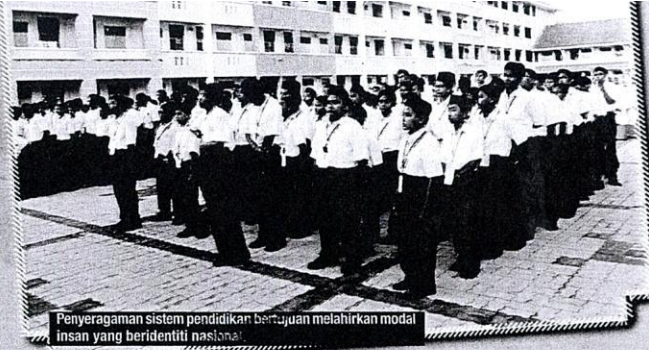
Penyeragaman sistem pendidikan bertujuan melahirkan modal insan yang beridentiti nasional.

“Pada tahun 1980an, kerajaan merasakan bahawa isu kebudayaan kebangsaan dan perdebatan yang berkisar di sekitarnya masih berlaku, biarpun kadangkang hangat, tetapi dalam