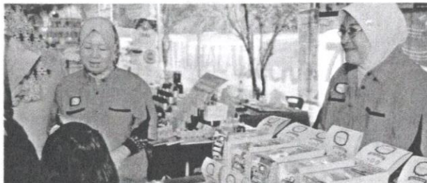
MARA banyak memberikan peluang usahawan bumiputera berdaya saing dalam bidang perniagaan.

MARA juga mewujudkan Program Usahawan Teknikal (PU TEK) yang mula dilaksanakan pada tahun 1996, iaitu tahun pertama dalam RMK-7. Pelaksanaannya berteraskan hasrat MARA dan kerajaan untuk melahirkan lebih banyak usahawan teknikal bumiputera di seluruh negara. Melalui program ini, usahawan baharu