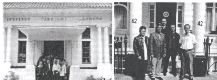
MARA menubuhkan pejabat di luar negara bagi melancarkan urusan pelajar tajaan.