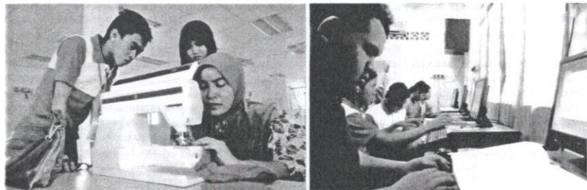
Latihan keusahawanan oleh MARA memastikan generasi muda lebih berdaya saing.

Kejayaan MARA membantu, membangunkan dan membentuk cita rasa serta budaya perniagaan serta perindustrian dalam kalangan bumiputera bertepatan dengan nama dan matlamat penubuhannya. MARA menjadi tonggak orang Melayu untuk terus berusaha mencapai matlamat pelbagai dasar kerajaan yang digubal dan dipinda. Kejayaan MARA membimbing golongan bumiputera agar bangkit untuk bersaing demi mencapai matlamat untuk mengimbangi pemilihan ekonomi negara menjadi bukti ketegasan agensi itu dalam membantu bumiputera menjadi "nadi" yang menggerakkan kemajuan negara.