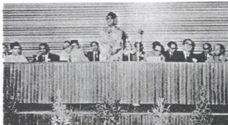
Kongres Ekonomi Bumiputera pada tahun 1965 mengubah RIDA menjadi MARA.

Kelahiran MARA seiring dengan pelancaran Rancangan Malaysia Pertama (1966 – 1970). Apabila Dasar Ekonomi Baharu (DEB) digubal selepas tragedi 13 Mei 1969. Pada ketika itu, MARA menjadi antara agensi yang diberikan tanggungjawab secara terus untuk mencapai matlamat serampang dua mata, iaitu membasmi kemiskinan dan menstrukturkan semula masyarakat berlandaskan objektif yang jelas untuk