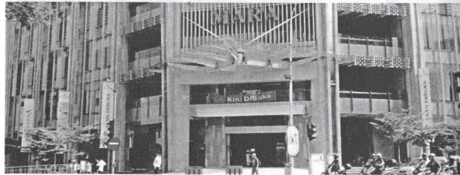
Bangunan MARA yang baharu menjadi mercu tanda kejayaan dan kemampuannya memajukan anak bumiputera.

Bahagian Kenderaan (BKN) ditubuhkan pada tahun 1960 di bawah Lembaga Kemajuan Kampung dan Industri yang dikenali sebagai RIDA. Tujuan penubuhan BKN adalah untuk memberikan perkhidmatan pengangkutan kepada penduduk di luar bandar terutamanya bagi peneroka FELDA dan seterusnya membantu bumiputera melibatkan diri dalam industri pengangkutan. Pada ketika itu, BKN dikenali sebagai Bahagian