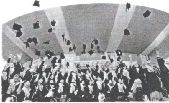
Lebih banyak graduan berkualiti dihasilkan bagi memenuhi keperluan modal insan dalam pasaran pekerjaan.

dan fizikal bagi menghadapi cabaran globalisasi.