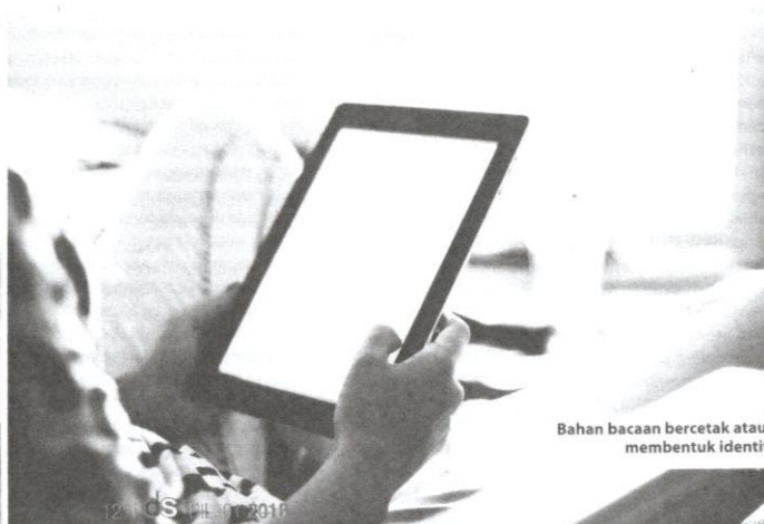
Bahan bacaan bercetak atau elektronik yang berkualiti mampu membentuk identiti dan jati diri masyarakat.