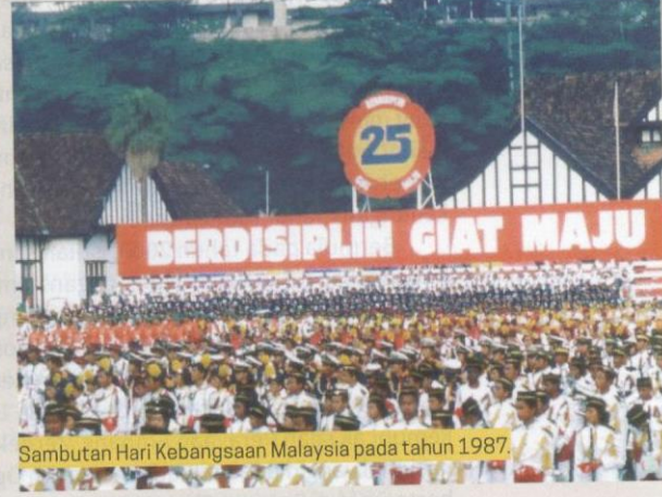
Sambutan Hari Kebangsaan Malaysia pada tahun 1987.

Acara yang paling menarik ialah YAB Tunku Abdul Rahman Putra al-Haj, Perdana Menteri Malaysia, telah menaiki gajah sambil diiringi ke pentas di Taman Bunga untuk menyampaikan surat pengisytiharan pembukaan Pesta Sepuluh Tahun Merdeka kepada DYMM Seri Paduka Baginda Yang di-Pertuan Agong, Tuanku Ismail Nasiruddin Shah Ibnu Almarhum Sultan Zainal Abidin.