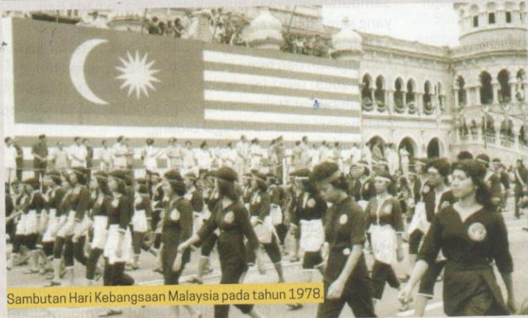
Sambutan Hari Kebangsaan Malaysia pada tahun 1978.