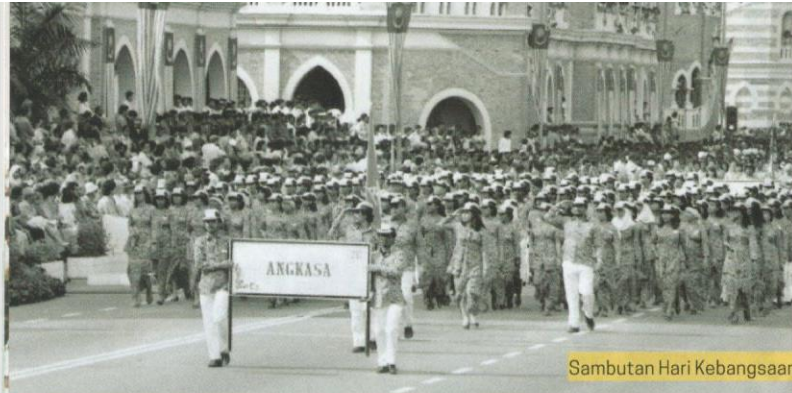
Sambutan Hari Kebangsaan Malaysia pada tahun 1987.