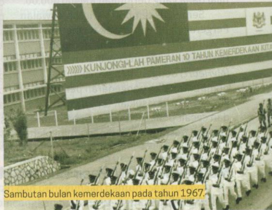
Sambutan bulan kemerdekaan pada tahun 1967.

Tahun 1967 merupakan sambutan ulang tahun ke-10 kemerdekaan negara. Acara sambutan pada tahun tersebut lebih meriah daripada tahun sebelumnya. Antara acara yang diadakan termasuklah perbarisan raksasa, rapat umum dan perhimpunan kanak-kanak dan belia. Sempena ulang tahun ini, Panggung Anniversary, iaitu sebuah pentas terbuka siap dibina di Taman Bunga, Kuala Lumpur pada 25 Ogos 1967.