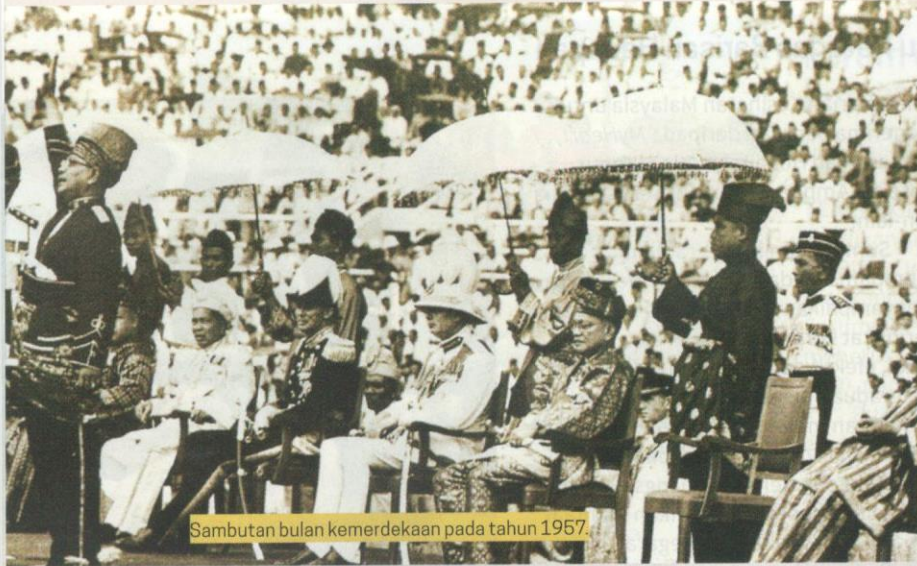
Sambutan bulan kemerdekaan pada tahun 1957.