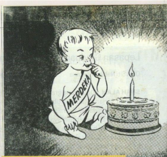
Sambutan bulan kemerdekaan pada tahun 1958.

DIAN KECHIL BERJASA JUGA, MENJADI SULOH DUNIA PANCHAROBA.