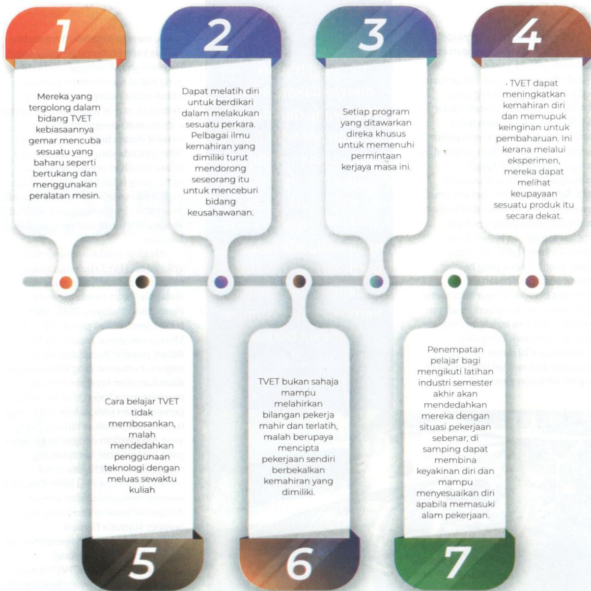
Rajah 1: Kelebihan TVET

yang dijanakan daripada kursus TVET yang disediakan kepada industri untuk perbelanjaan seperti menaik taraf peralatan dan melantik tenaga pengajar daripada industri. Geran padanan yang berjumlah RM20 juta disediakan bagi menyokong kursus TVET yang direka khas untuk dilaksanakan dengan menggalakkan