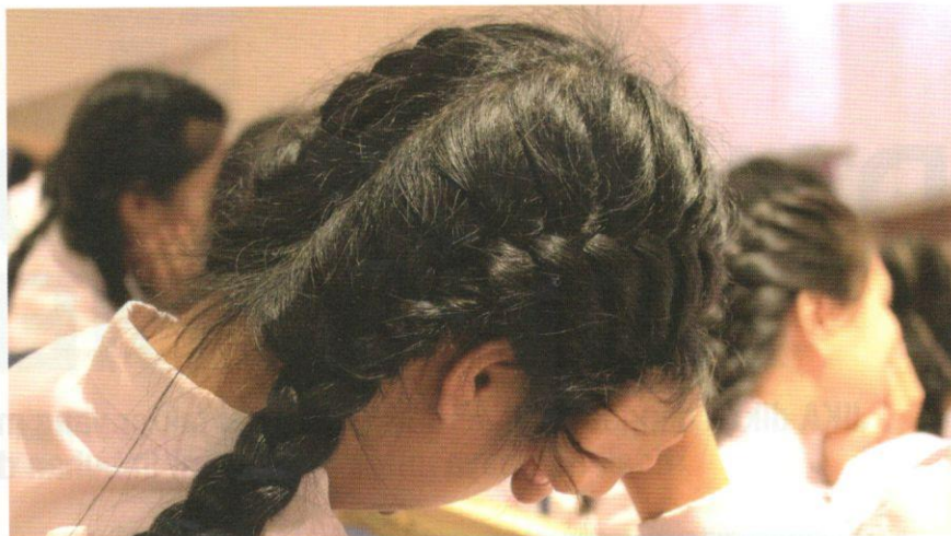
Jika lemah bertutur dalam bahasa Melayu boleh mengganggu proses pembelajaran murid.

Pelbagai faktor yang boleh dikaitkan dengan pembelajaran bahasa Melayu sebagai bahasa kedua murid India. Kegagalan untuk menguasai bahasa kedua bukan sahaja akan mempengaruhi prestasi murid India dalam peperiksaan subjek tersebut, malah murid juga akan mengalami kekangan dalam berkomunikasi pada masa hadapan. Dalam hal ini, faktor sosial merupakan antara faktor yang sangat mempengaruhi pembelajaran bahasa kedua murid India. Jika dilihat dengan lebih mendalam, faktor sosial merangkumi beberapa aspek seperti rakan, keluarga, persekitaran sekolah, motivasi dan sikap murid. Berikutan itu, faktor sosial yang paling mempengaruhi pembelajaran bahasa Melayu sebagai bahasa kedua ialah faktor motivasi murid. Murid India cenderung mengatakan aspek motivasi lebih mempengaruhi mereka berbanding aspek sosial yang lain. Murid yang mempunyai motivasi untuk mencapai kejayaan dalam pendidikan bahasa membolehkan mereka menguasai bahasa kedua mereka dengan lebih