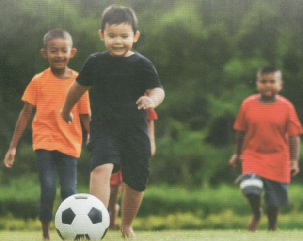
Dia bermain di padang. (ayat betul)

Pengimbuhan merupakan proses pembentukan kata yang ada dalam bahasa Melayu yang mudah sifatnya. Boleh dikatakan bahawa kebanyakan bentuk kata yang ada dalam bahasa Melayu dibentuk dengan proses pengimbuhan. Setiap murid didapati melakukan kesilapan dalam aspek imbuhan