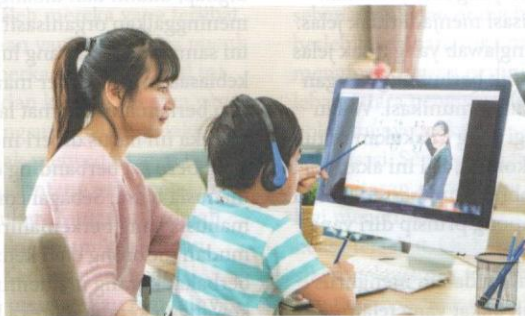
Bimbingan motivasi dan ruang yang kondusif membantu konsentrasi pelajar semasa mengulang kaji pelajaran.

Penulis , Pensyarah Kanan, Kolej Ekonomi Tenaga dan Sains Sosial, Universiti Tenaga Nasional, Kampus Putrajaya.