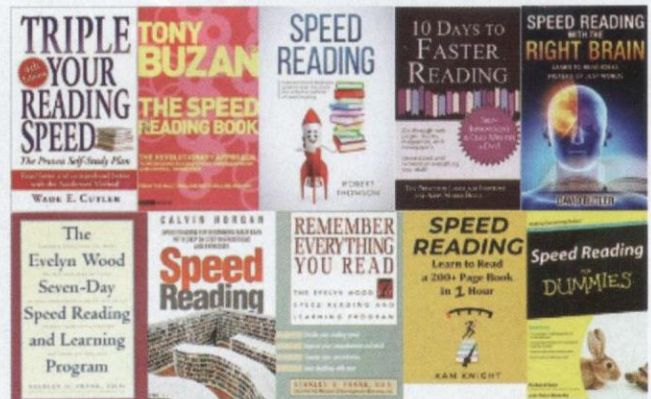
Antara buku yang boleh dijadikan rujukan kepada pembaca untuk mengetahui teknik membaca pantas.

Bagi pemula, penulis sarankan agar pembaca memilih buku The Speed Reading Book , tulisan Tony Buzan. Buku ini terdapat dalam versi bahasa Inggeris dan bahasa Melayu. Buku ini mudah untuk dibaca dan difahami, dan disertai dengan contoh bagi meningkatkan kefahaman pembaca. - tr