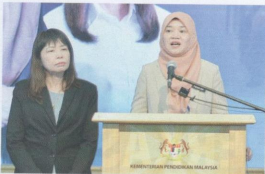
Menteri Pendidikan, YB Fadhlina Sidek menggariskan tujuh agenda pendidikan negara dalam usaha membina ekosistem yang harmoni.

Menteri Pendidikan, YB Fadhlina Sidek dalam amanat pertama beliau sebaik-baik sahaja diberi tanggungjawab menerajui KPM telah menggariskan tujuh agenda pendidikan negara yang akan diberi tumpuan sepanjang pentadbirannya. Dalam usaha membina ekosistem yang harmoni antara semua pemegang taruh dalam pembangunan pendidikan negara, KPM menetapkan untuk memberikan keutamaan kepada isu keciciran pembelajaran, kebajikan guru, membina komunikasi yang baik antara KPM dengan sekolah, isu kemiskinan multidimensi, penekanan terhadap aspek karamah insaniah , menaiki taraf sekolah daif dan meningkatkan pendidikan digital.