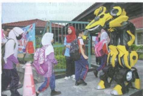
Konsep keseronokan yang diperkenalkan kepada murid pada minggu pertama penggal persekolahan memberikan pendekatan yang positif.