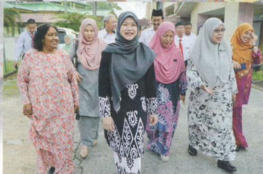
YB Fadhina Sidek semasa melawat sebuah sekolah dalam usaha menaik taraf infrastruktur sekolah.

dengan akal yang baik dari semua aspek. Murid yang dilahirkan daripada institusi sekolah yang berjaya bukan sahaja mempunyai nilai manusia yang berkualiti dari aspek adab dan tatasusila, malah cemerlang dan pakar dalam pelbagai bidang yang ditekuni oleh mereka.