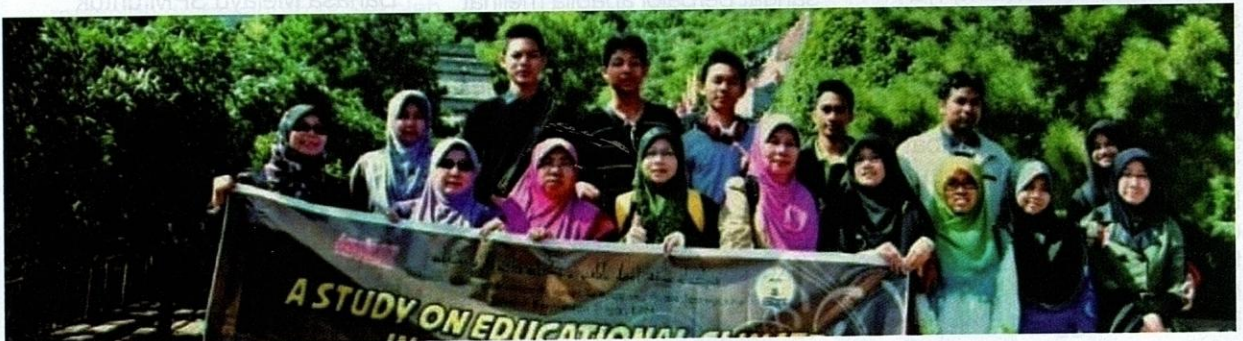
Penulis terpilih sebagai Guru Pengantarabangsaan di Beijing pada tahun 2013.

Sebagai mengakhiri tinta nukilan rasa selaku seorang guru, saya berharap agar Allah Taala menganugerahi saya kesihatan yang baik dan umur yang panjang. Mudah-mudahan, diri ini berpeluang untuk melihat perubahan dunia pendidikan pada masa akan datang. Saya juga berharap agar segala perubahan tersebut mampu melahirkan insan yang bukan sahaja bijak, malah kental jati dirinya, seterusnya membentuk masyarakat yang terbilang dan tersohor. PB