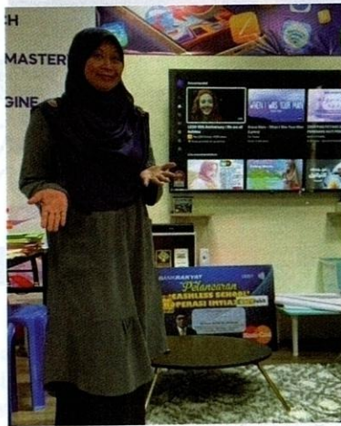
Bilik inovasi yang dilengkapi set televisyen dan studio untuk digunakan oleh pelajar.

Saya sangat berharap agar dapat melahirkan generasi yang ahlakunya sangat luhur melalui proses pendidikan dan suasana pembelajaran yang terbaik. Tambahan pula, adab dan susila guru yang terpuji, disulami dengan kecerdikan akal yang luar biasa, pasti dapat melahirkan generasi yang maju