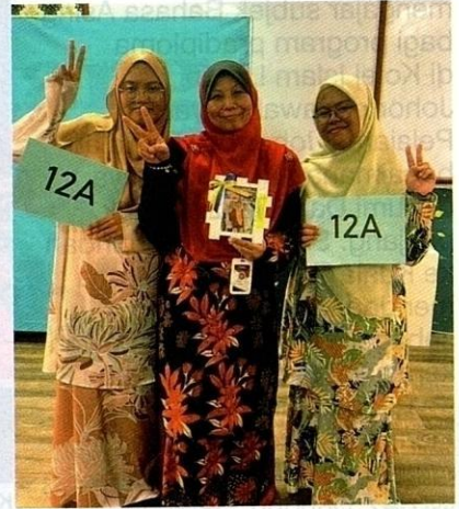
Penulis bersama-sama dua orang pelajar yang memperoleh 12A dalam peperiksaan SPM 2022.

dan bertamadun tinggi. Semua aspek ini dapat meningkatkan tahap profesionalisme guru dengan penggunaan maklumat yang berinovasi.