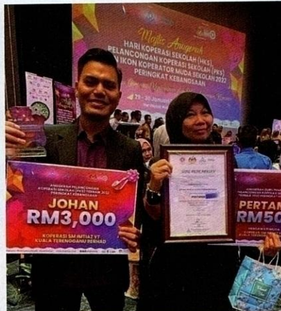
Kenangan memperoleh Anugerah Guru IKON PKS peringkat kebangsaan di Selangor pada awal Januari lalu.

Setelah hampir lima tahun berkhidmat di bumi Dungun, saya dipinjamkan ke pejabat Yayasan Terengganu di bawah Bahagian Pengurusan IMTIAZ untuk mengendalikan program Ensiklopedik bagi memantapkan bahasa Perancis di sekolah IMTIAZ Terengganu. Selepas dua tahun di pejabat tersebut,