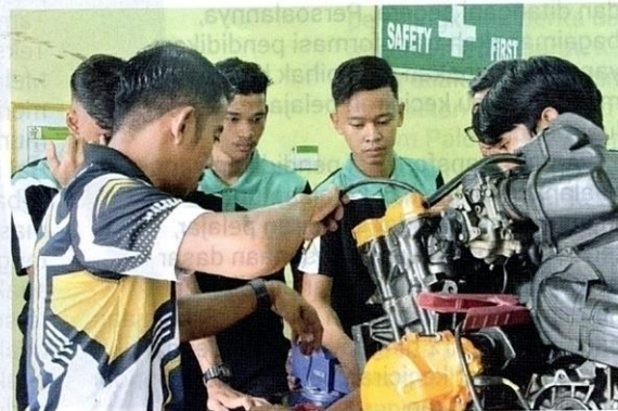
Program transformasi pendidikan diadakan bagi memastikan kadar keciciran pelajar di Malaysia dapat dikurangkan.

Di samping itu, transformasi pendidikan yang mampu mengatasi masalah keciciran pelajar adalah dengan mempelbagaikan gaya dan cara pengajaran di dalam dan di luar bilik darjah. Hal ini disebabkan oleh strategi pengajaran yang menarik dan kreatif mampu menarik minat pelajar untuk ke sekolah. Berdasarkan