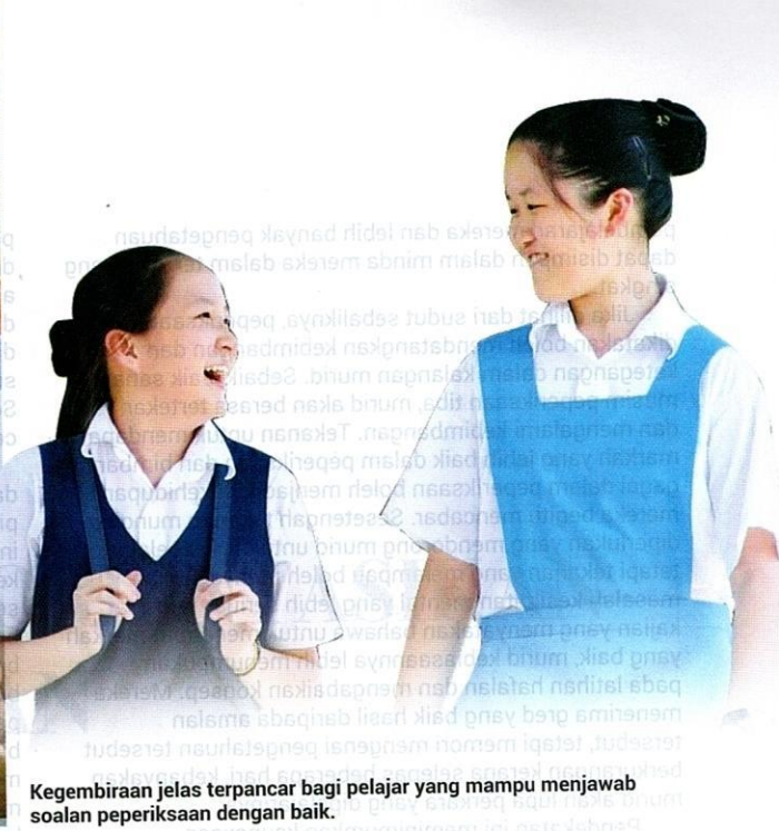
Kegembiraan jelas terpancar bagi pelajar yang mampu menjawab soalan peperiksaan dengan baik.

melibatkan kepercayaan bersama dalam kalangan warga sekolah, murid dan ibu bapa bahawa setiap kanak-kanak mempunyai potensi dan mampu belajar, dan persekitaran yang selamat dan inklusif. Sebagai pensyarah universiti yang mendidik bakal guru sekolah, penulis sering mengingatkan kepada pelajar bahawa tiada gunanya mengejar untuk menghabiskan silibus sehingga tamat takwim sekolah, namun akhirnya murid tidak memperoleh sebarang manfaat. Sebaliknya, hal ini lebih bermakna sekiranya kita mewujudkan persekitaran pembelajaran yang menarik, melibatkan murid secara aktif dalam kelas, dan akhirnya walaupun mungkin silibus tidak dapat dihabiskan, murid memperoleh dan dapat belajar sesuatu dalam kelas tersebut terutamanya murid yang mempunyai latar belakang akademik yang lemah.