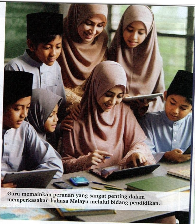
Guru memainkan peranan yang sangat penting dalam memperkasakan bahasa Melayu melalui bidang pendidikan.

Kerjasama antara sekolah, ibu bapa dan komuniti adalah penting dalam memperkasakan bahasa Melayu. Ibu bapa boleh