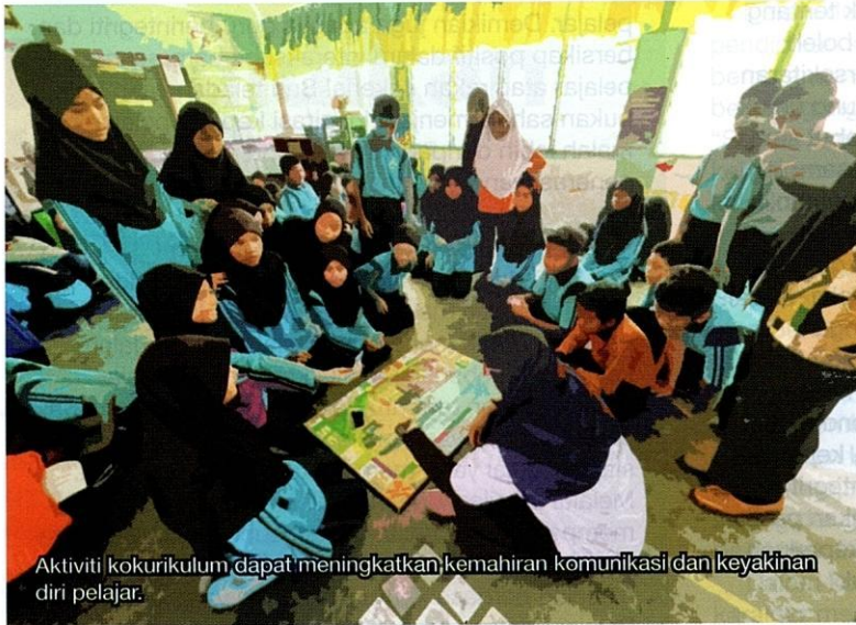
Aktiviti kokurikulum dapat meningkatkan kemahiran komunikasi dan keyakinan diri pelajar.

kesan terhadap gaya hidup, mala turut membentuk pola pemikiran dan sikap pelajar dalam pelbagai aspek kehidupan mereka. Akibat terpengaruh dengan imej dan nilai yang dipaparkan dalam media sosial, pelajar mungkin lebih cenderung untuk mengikuti trend tanpa mempertimbangkan impaknya terhadap identiti dan keputusan yang dibuat dalam kehidupan seharian mereka.