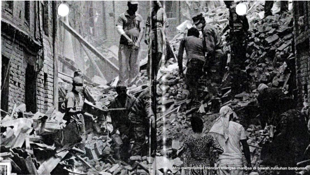
Misi menyelami mencari mangsa-mangsa di bawah runtuhan bangunan.

Setibanya kami di kawasan yang lebih selamat, saya lihat ribuan penduduk tempatan dan para pelancong berkumpul dalam keadaan cemas dan ketakutan. Di situ jugalah saya baru diberitahu kawasan bandar itu dilanda gempa bumi berukuran 7.9 skala Richter. Subhanallah!! Allahuakbar!!