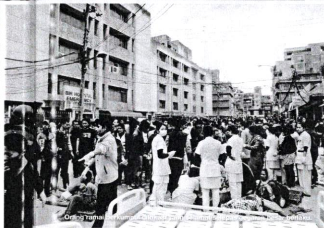
Orang ramai berkumpul di kawasan yang dilanda gempa bumi dan bising berakut.