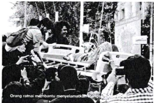
Orang ramai membantu menyelamatkan mangsa-mangsa.