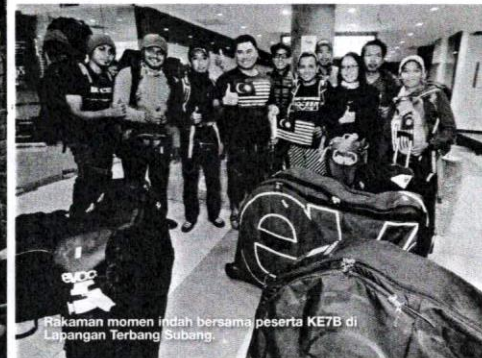
Rakaman momen indah bersama peserta KE7B di Lapangan Terbang Subang.

Bersiap sedia memulakan kayuhan dari kem pemindahan ke lapangan terbang Tribhuvan untuk melakukan pengesahan