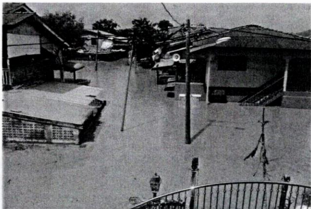
Banjir buruk di Kelantan baru-baru ini membuka mata banyak pihak untuk mencari mekanisme amaran awal banjir.

Apabila berlakunya bencana, pengurusan yang cekap diperlukan untuk mengurus situasi yang sukar. Penggunaan sumber yang berkesan, pelibatan pelbagai agensi, dan tenaga manusia dalam jangka masa yang panjang diperlukan untuk memulihkan keadaan kesan daripada bencana. Pengurusan bencana yang berkesan turut melibatkan tiga tahap yang utama, iaitu persediaan sebelum bencana, pengurusan semasa bencana, dan pengurusan selepas bencana. Pada tahap sebelum bencana, komunikasi atau sistem amaran awal memainkan peranan yang cukup penting. Hal ini dikatakan