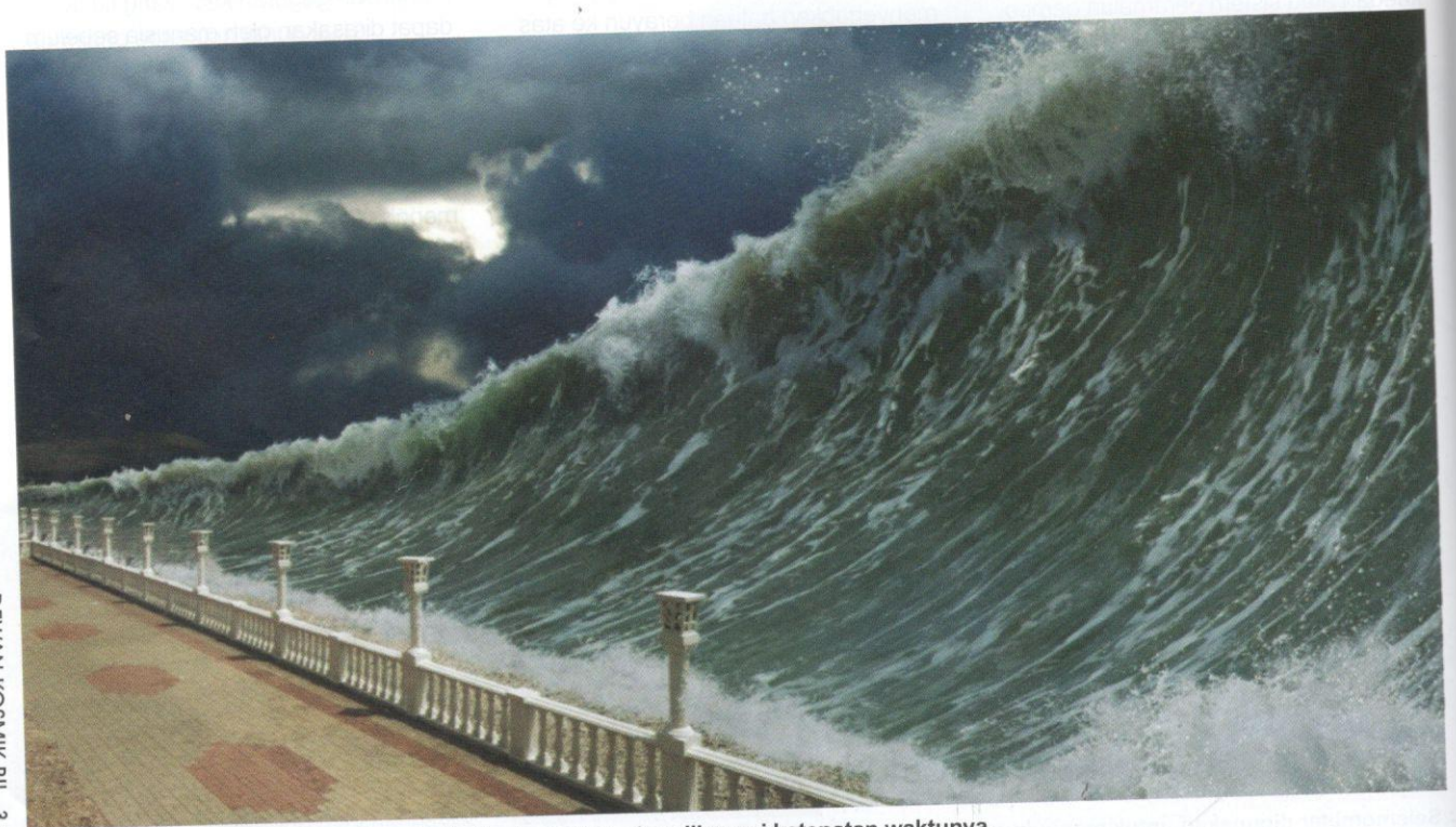
Peramalan jangka panjang terhadap kejadian tsunami sukar dikecapi ketepatan waktunya.

Medan geomagnet ialah medan magnet yang melitupi Bumi bagi melindungi planet daripada angin suria yang mengandungi zarah bercas. Keadaan ini juga mengelakkan kebocoran lapisan ozon yang memayungi kita daripada sinaran ultralembayung berbahaya. Medan ini dicerap oleh alatan yang dipanggil magnetometer. Kompas yang mampu menunjukkan arah mata angin dengan menjajarkan jarumnya selari dengan arah medan geomagnet utara-selatan merupakan sejenis magnetometer ringkas.