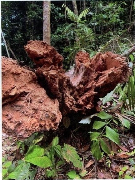
Proses pereputan pada setiap bahagian tumbuhan mengambil masa yang berbeza-beza dan bergantung pada saiz serta komposisi kimia daun.