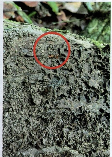
Serangga di lantai hutan berperanan dalam membantu penguraian bahagian tumbuhan yang telah mati.