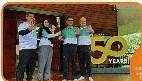
Aktiviti yang diadakan bersempena dengan sambutan ulang tahun ke-50 PETRONAS di Kanyon Imbak.