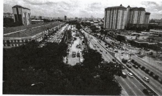
Keutuhan perkembangan ekonomi menjadi kayu ukur terhadap keupayaan sebuah kerajaan.

Pemimpin yang menyatukan rakyat untuk tujuan keamanan negara selalunya lebih disukai berbanding pemimpin yang memecahbelahkan rakyat.