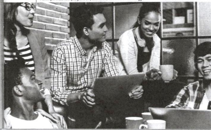
Pemimpin masa hadapan perlu arif, berwibawa dan berwawasan tinggi.

Jika kita teliti butir perbincangan yang berlegar-legar sekitar isu kepemimpinan menjelang pilihan raya umum, kita dapat melihat pola yang membimbangkan. Alir arah isu yang dibangkitkan, sama ada dalam media massa, laman