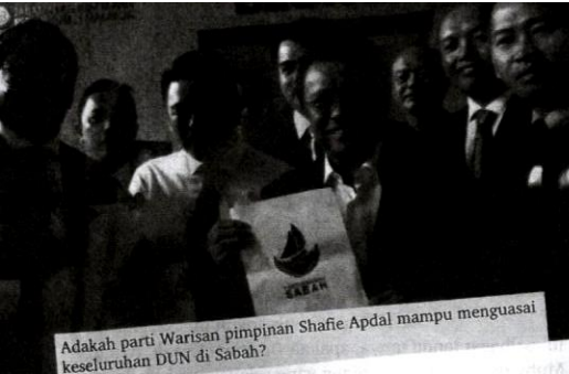
Adakah parti Warisan pimpinan Shafie Apdal mampu menguasai keseluruhan DUN di Sabah?

masih bergema, boleh dimanfaatkan dan dengan itu beliau amat berhati-hati agar tidak berkesudahan dengan "untung sekarang rugi seguni".