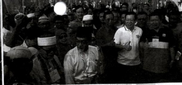
PAS mengambil keputusan untuk bersendirian pada PRU-14 kelak.

perhatian utama kepada golongan ini sebenarnya. Memang mereka berada di atas pagar, tetapi keputusan mereka turut mampu menggegarkan.